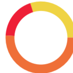
CUENTA PRODUCTIVA ESPECIAL (Saldo inicial de $7,356,997.41)